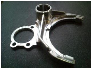
机动车相关试做零部件 SCM440