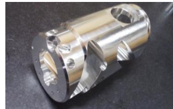
光学机器零部件(μ m的精度) A5056